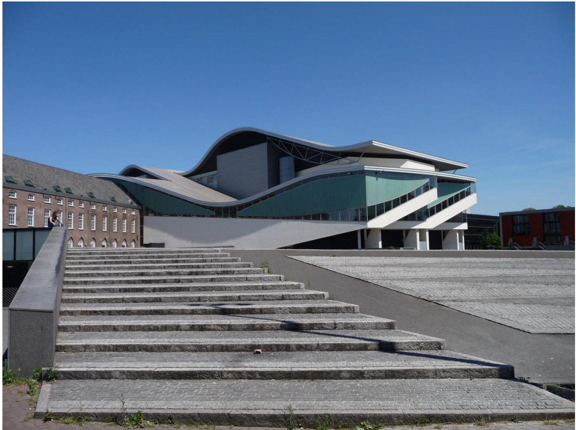
23 oktober 2011: Najaarsconcert in het Chassé Theater van Breda