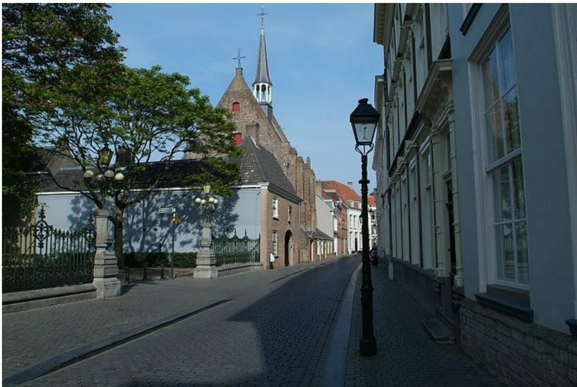
Catharinastraat met Waalse Kerk (1440) in Breda