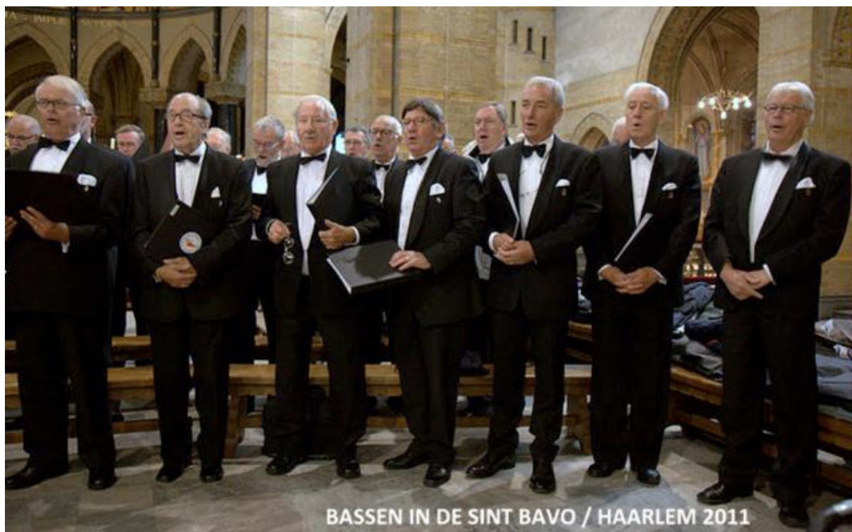
BASSEN IN DE SINT BAVO / HAARLEM 2011